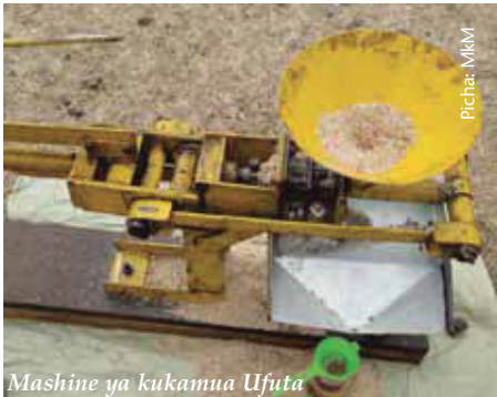
Mashine ya kukamua Ufuta

Mashine ya daraja ni moja ya mashine za kisasa zinazoweza kukamua mafuta ya ufuta. Mashine hizi huendeshwa kwa mikono na zina uwezo wa kukamua mafuta kwa asilimia 68 hadi 72. Inawezekana