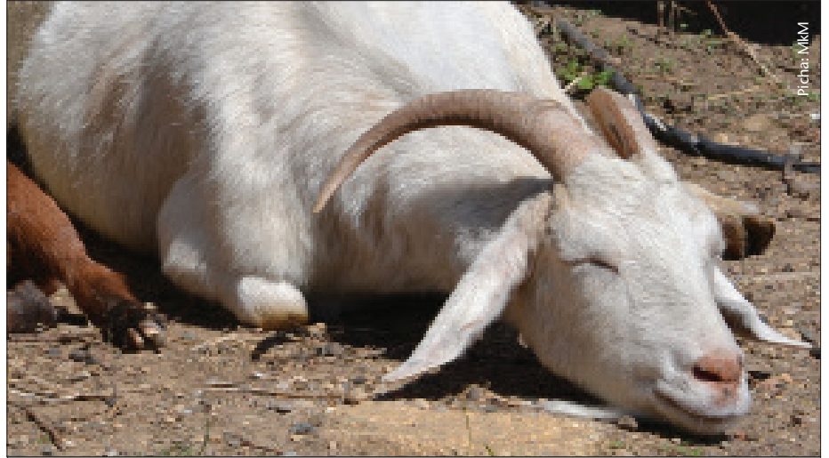
Mbuzi mwenye homa ya mapafu huonekana mchovu na mwenye usingizi

Tatizo lililopo ni ugumu wa kuthibitisha ugonjwa huu hasa kwa njia ya kuotesha wadudu lakini uwepo wa teknolojia mpya kama PCR utawezesha kuutambua ugonjwa huu kwa haraka zaidi.