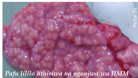
Pafu lililo athirwa na ugonjwa wa HMM

Maabara kuotesha wadudu na kutambua kwa njia za kikemikali (ELISA na PCR).