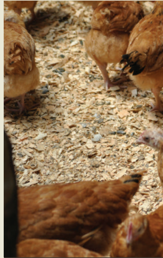
Vifaranga wakitunzwa vizuri ni dhahiri kuwa

nishati, ambazo zimebuniwa hapa nchini na kufanyiwa utafiti wa kina na kuonekana kuwa na uwezo mkubwa wa kulea vifaranga.