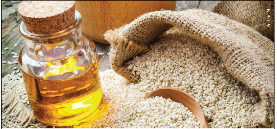
Mbegu za ufuta zikikamuliwa zinatoa mafuta yaliyosafi na salama kwa afya

Aidha, kunahitajika pia kuwepo na mifuko midogo ya nguo au viroba