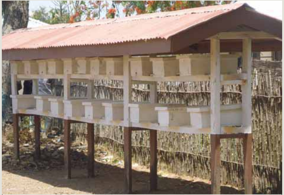
Kibanda cha kuweka mizinga ya nyuki

kuwafanya nyuki wasihame kwenda sehemu nyingine.