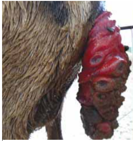
Ugonjwa wa prolapsi kabla ya tiba

Vagina prolapse: Tatizo hili huji-tokeza kwa wanyama wakubwa hasa walio katika hatua ya mwisho ya ujauzito. Lakini mara chache limeonekana kwa wanyama wasio wajawazito hasa ambao hawajaanza kuzaa na kwa wanyama waliotoka kuzaa. Kwa wanyama wanaokaribia kuzaa tatizo husababishwa na mabadiliko makubwa ya vichocheo vya mwili