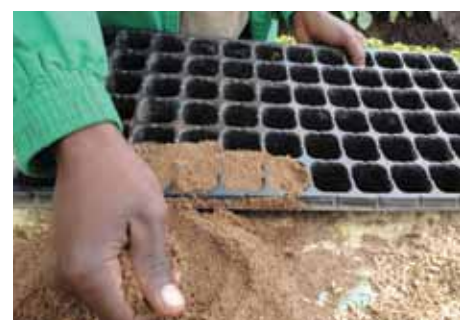
Kitalu cha kisasa

*Tahadhari: Kamwe usitumie mifuko ya nailoni kupandia mboga