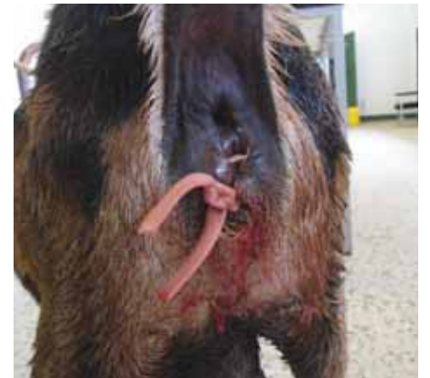
Mbuzi baada ya kufanyiwa tiba

Mifugo wako wapatapo matatizo haya ni vizuri ukwasiliana na mtaalamu aliyekaribu nawe ili akusaidie au wasiliana na wataalamu waliopo Kitivo cha Tiba Mifugo Chuo Kikuu cha Sokoine cha Kilimo, au wengineo walio karibu nawe.