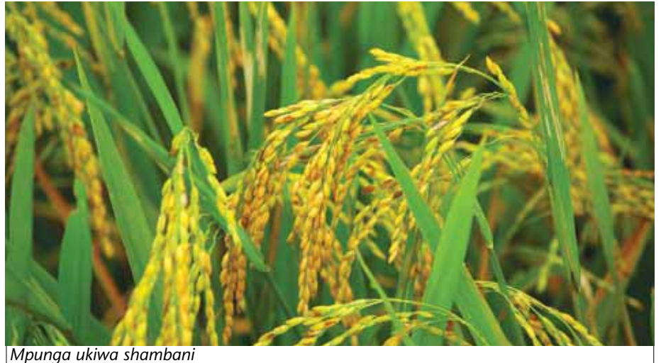
Mpunga ukiwa shambani

• Unaweza kupanda kwa kumwaga mbegu shambani. Mbinu hii hurahisisha nguvu kazi. Hata hivyo mbinu hii ina hasara zake kama vile kiwango cha mbegu zinazoota, na pia uwepo wa