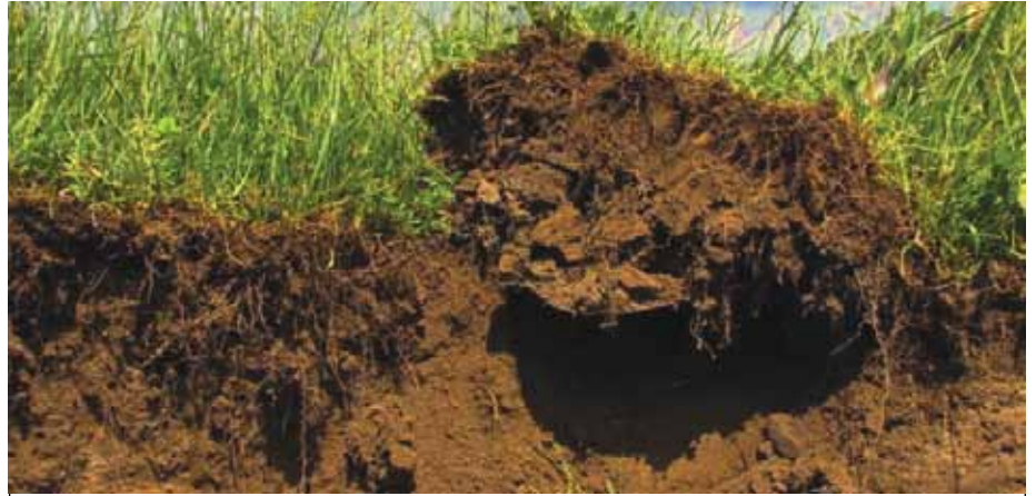
Ni vyema kuzingatia matunzo ya udongo ili uweze kupata matokeo bora.

bali za kilimo ambazo husaidia katika uboreshaji na utunzaji wa afya ya udongo hulenga zaidi katika;