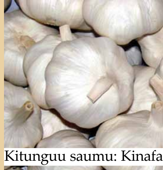
Kitunguu saumu: Kinafa

Unga wa mbegu za utupa, unaweza kusababisha samaki wapooze ( paralyse ).