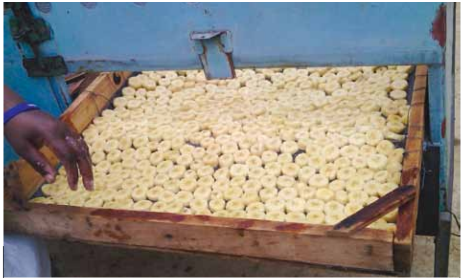
Ndizi zikiwa zimepangwa kwenye kikaushio cha sola tayari kwa kukaushwa.