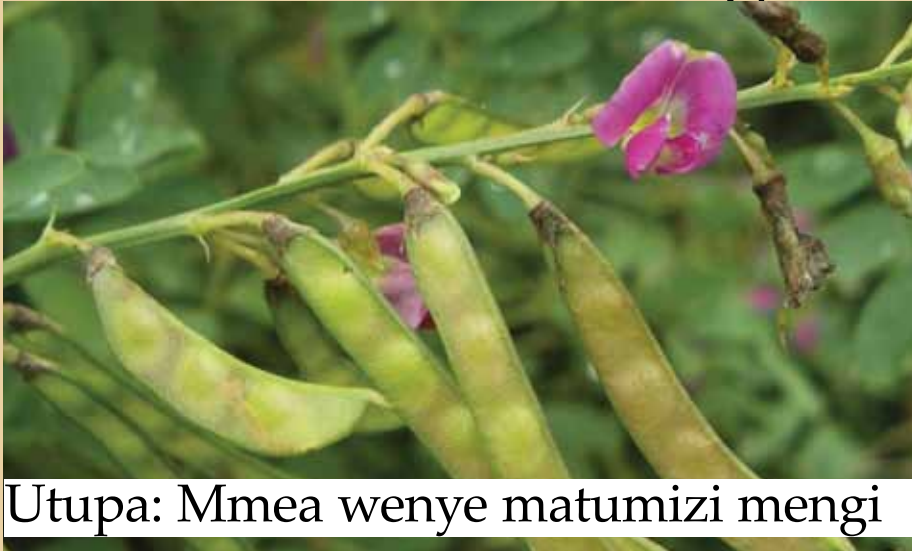
Utupa: Mmea wenye matumizi mengi

Utupa ni aina ya mmea unaopatikana zaidi sehemu zenye baridi hasa nyanda za juu na unastawi sehemu zenye mvua za wastani na nyingi. Mmea huu hauhimili ukame.