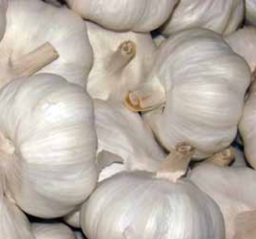
...a kufukuza wadudu