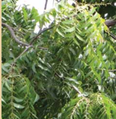
Muarobaini hufukuza wadudu na kutibu