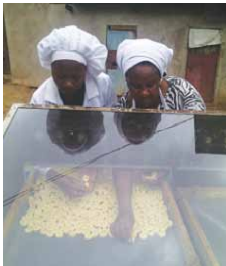
Zingatia upangaji sahihi wa ndizi kwenye kikaushio.