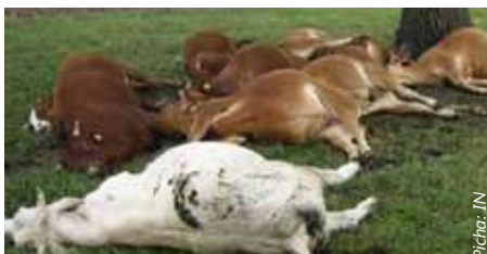
Ugonjwa wa kimeta husababisha vifo vya ghafla na mnyama hufa akiwa na afya.

• Vifo vya ghafla. Dalili moja kuu ambayo hujitokeza kwa mnyama mwenye ugonjwa wa kimeta ni mnyama kufa ghafla bila hata mfugaji kutambua kama mnyama huyo ameshakuwa na maambukizi ya ugonjwa huu.