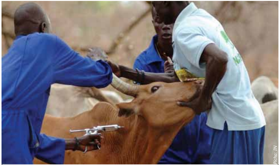
Njia pekee ya kupambana na ugonjwa wa kimeta ni kuchanja mifugo mara kwa mara ili kuwaepusha na ugonjwa huu hatari.

• Kuhema kwa shida. Kwa mfugaji mzuri na anayechunguza mifugo yake kila siku huweza kutambua kama mnyama amepatwa na ugonjwa wa kimeta kutokana na kuhema kwake ambapo tofauti na kawaida mnyama hupata shida sana katika kuhema (kuvuta na kutoa pumzi).