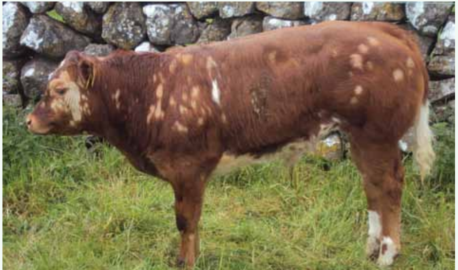
Mnyama mwenye dalili za ugonjwa wa ukurutu huanza kupoteza manyoya katika sehemu mbalimbali za mwili.

Hii ni aina nyingine ya ukurutu ambao huenezwa kwa njia ya kugusana kati ya mnyama na mnyama (mwenye ugonjwa na asiyekuwa na ugonjwa). Huathiri wanyama kama ng'ombe, kondoo, nguruwe, mbwa, mbuzi, farasi.