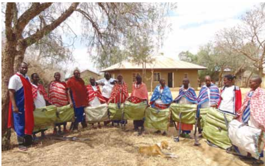
Wanakikundi wa EOLS wakiwa na baadhi ya matandiko waliyoyatengeneza.

Dawa na chanjo: Kama ilivyo kwa mifugo mingine, ni muhimu kuwasiliana na wataalamu ili punda apatiwe chanjo pamoja na kutibiwa kwa usahihi pindi anapokumbwa na magonjwa.